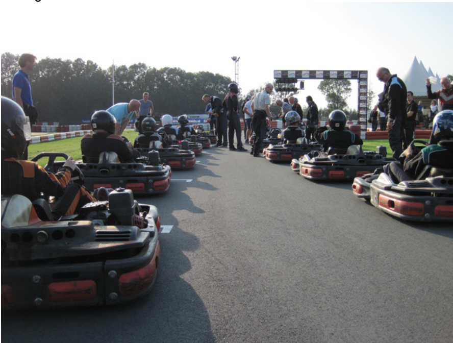
BKL Kart Event