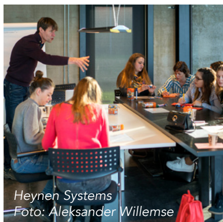
Heynen Systems

Aansluiting arbeidsmarkt en bedrijfsleven